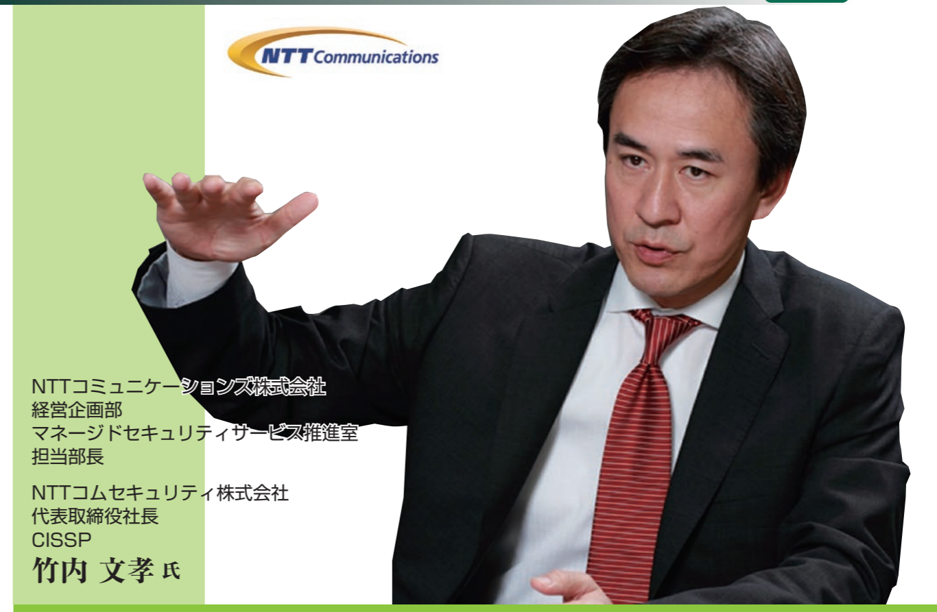
NTTコミュニケーションズ株式会社 経営企画部 マネージドセキュリティサービス推進室 担当部長